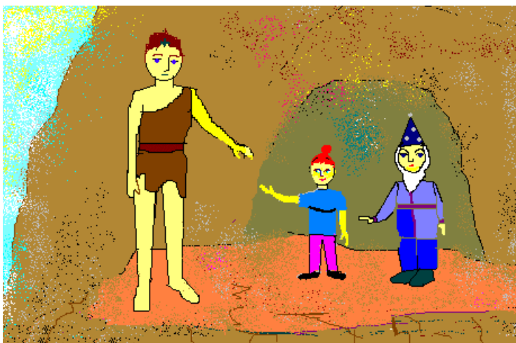
Veras Mišurinas zīmējums

Kad Sigvards sasniedza klinšu dobumu, viņš dzirdēja lejā zēnu balsis, bet savā priekšā ieraudzīja divus troļļus. Viens bija zilā cepurē ar garu, sirmu bārdu, bet otrs izskatījās kā troļļu zēns Sigvarda vecumā.