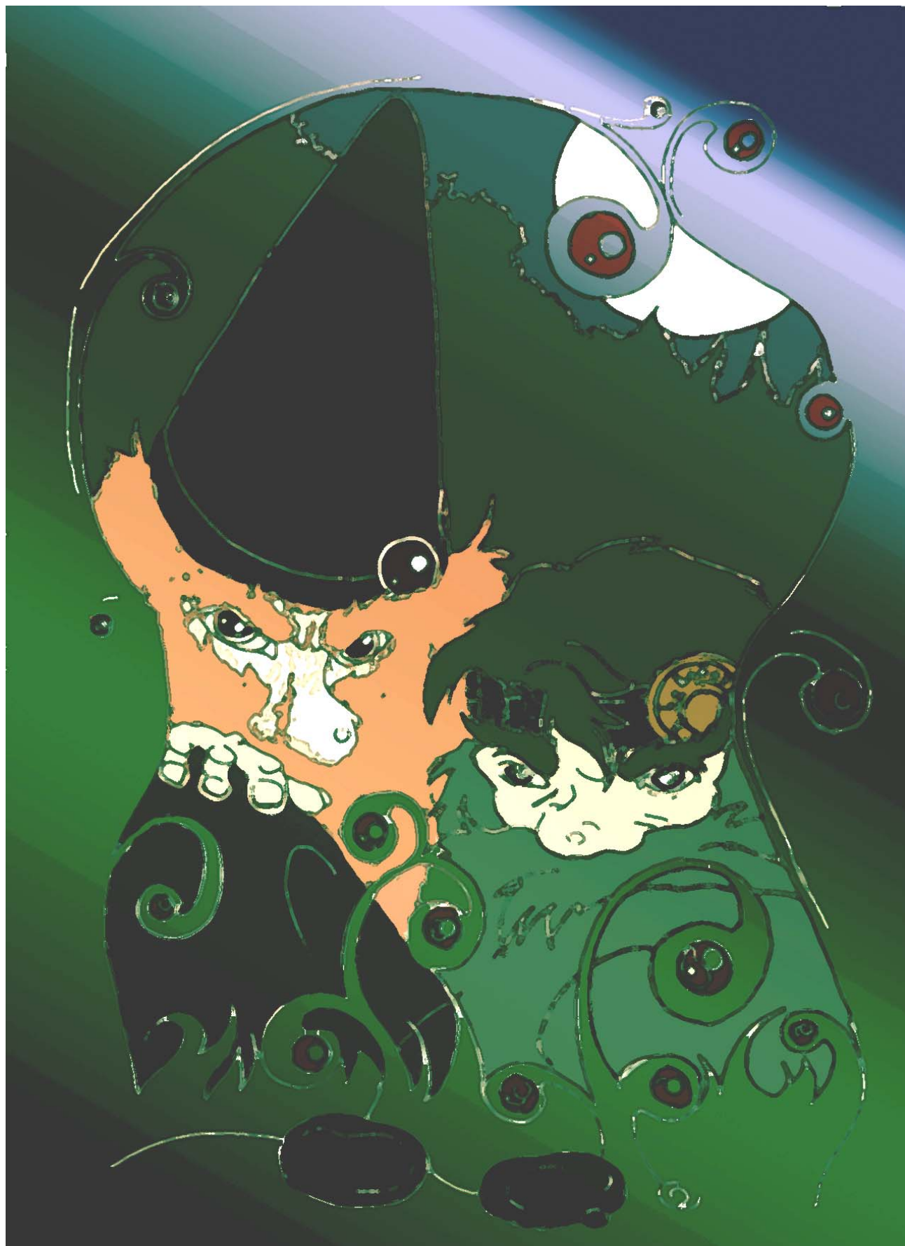
Zintnieks un Laikadabzinis Gaļinas Žabinas zīmējums